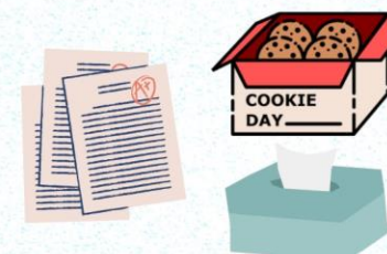
紙類(コピー用紙、 お菓子の箱等)