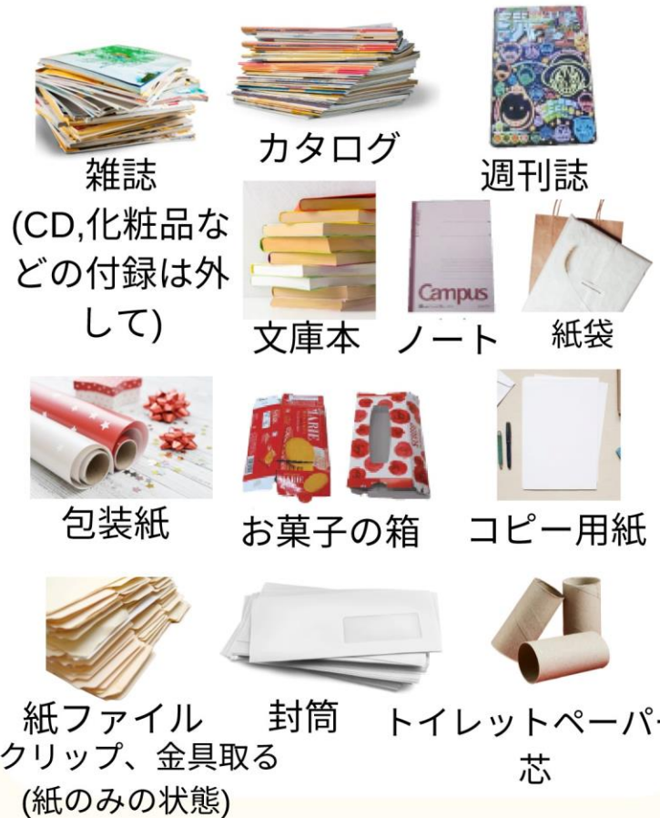
雑誌 (CD,化粧品などの付録は外して)