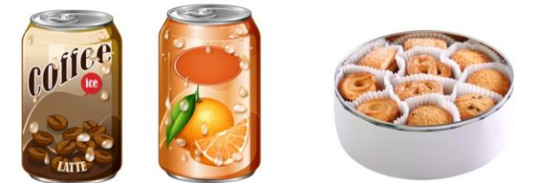
ジュース缶 お菓子の缶