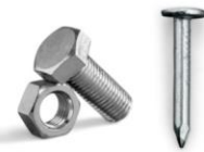
釘・ボルト ・ナット