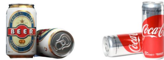
ビール缶 ジュースの缶