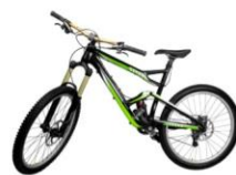
自転車 (タイヤ付きでもOK)