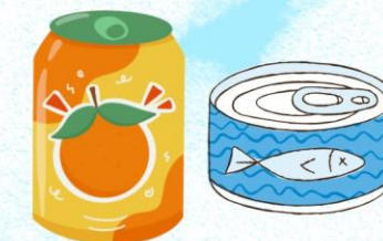
空缶(アルミ、スチール)