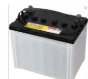
バッテリー (車、バイク)